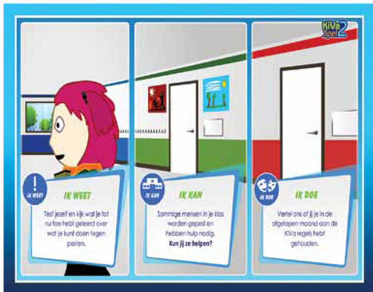
Figuur 2 Beginscherm KiVa-spel (met drie leerniveaus: 'ik weet', 'ik kan' en 'ik doe').