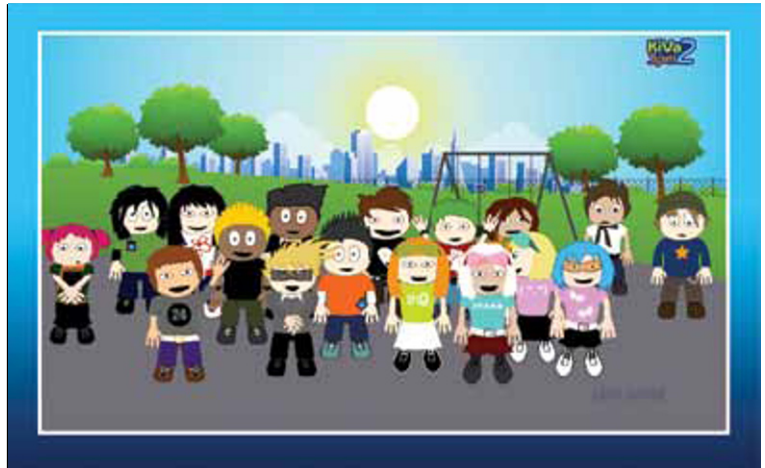
Figuur 4 KiVa-karakters uit het computerspel.

Scholen vinden het fijn dat er in de steungroepaanpak niet terug, maar vooruit wordt gekeken. Leerkrachten geven aan dat ze in het verleden veel te veel bezig waren met uitzoeken wie wat had gedaan. Dat maakte