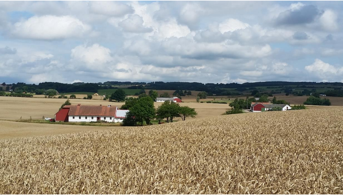
Morenelandschap in Skåne (Zuid-Zweden)