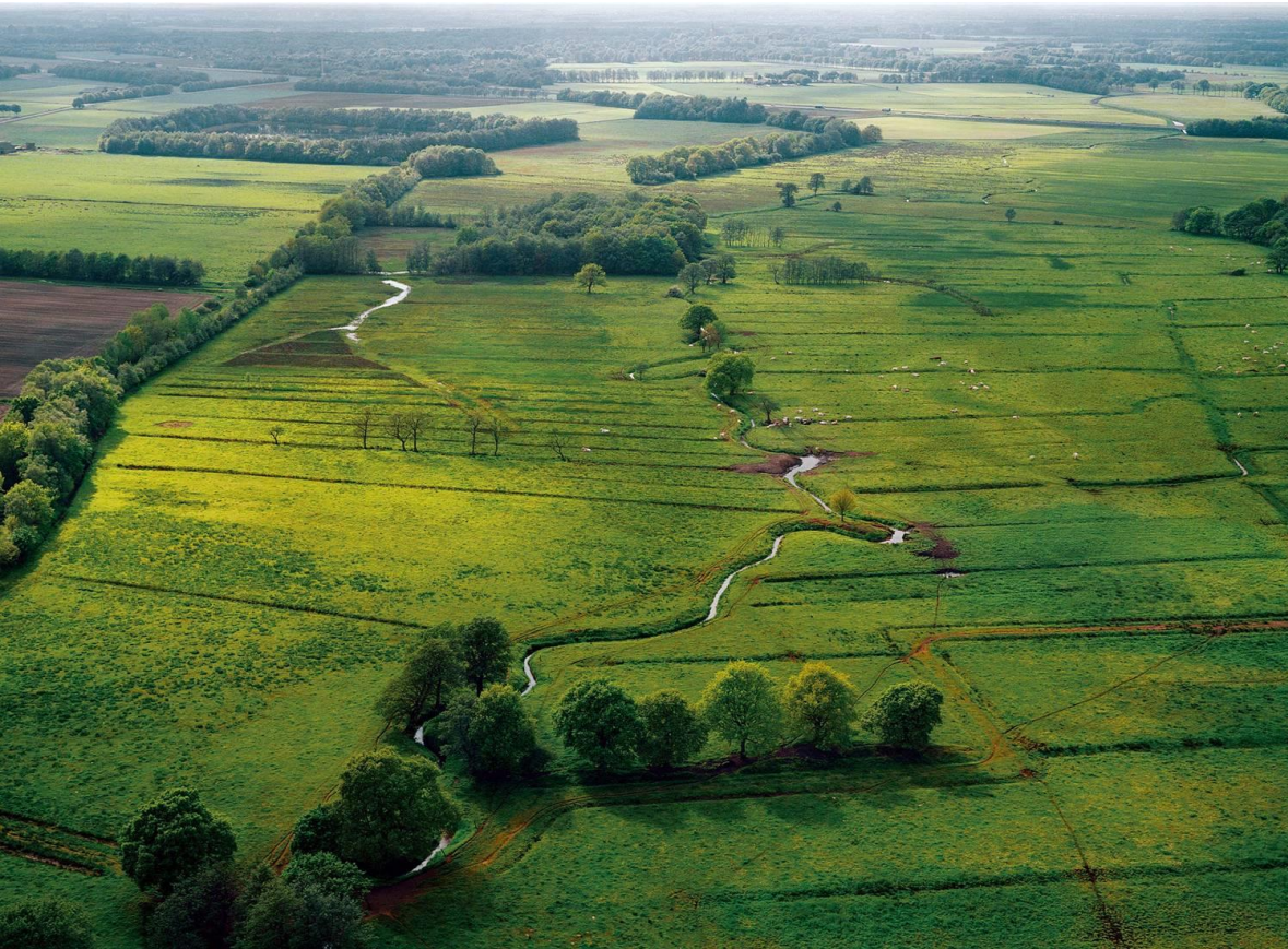
Het Drentse Aa-gebied bij Anderen.

De Rijksuniversiteit Groningen verzorgt sinds 2008 een éénjarige masteropleiding Landschapsgeschiedenis die zich richt op verleden, heden en toekomst van het Nederlandse en Europese landschap. Deze Nederlandstalige interdisciplinaire opleiding is breed toegankelijk voor zowel universitaire als HBO-afgestudeerden en leidt op voor een breed werkveld van wetenschappelijk onderzoek, ruimtelijke ordening, erfgoedzorg, natuur- en landschapsbeheer, landschapsplanning en landschapsbeleid.