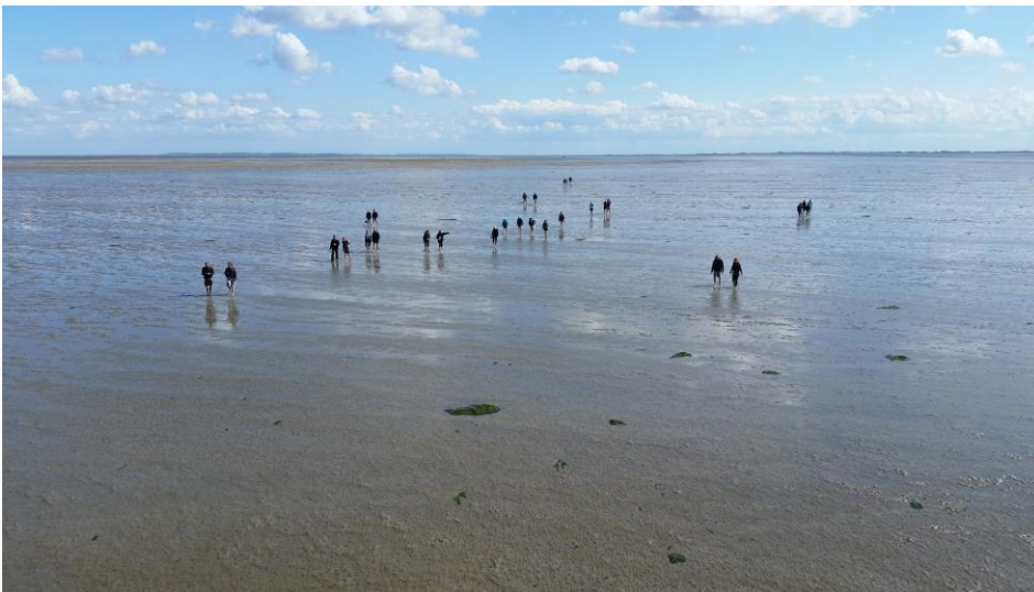
Excursie masterstudenten Landschapsgeschiedenis naar Engelsmanplaat in de Waddenzee.