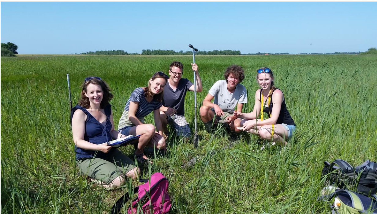
Veldwerk tijdens het veldpracticum Historische Geografie in Gaasterland (Zuidwest-Friesland)

De éénjarige masteropleiding Landschapsgeschiedenis aan de Rijksuniversiteit Groningen is de enige masteropleiding in Nederland die zich exclusief richt op verleden, heden en toekomst van het landschap. Ook binnen Europa bestaan vrijwel geen vergelijkbare masteropleidingen. Doel van de opleiding is om een gedegen kennis te ontwikkelen van de opbouw, ontstaanswijze en betekenis van het landschap en deze actief te leren inzetten in de praktijk van ruimtelijke ordening, erfgoedzorg, landschapsbeleid, landschapsplanning en landschapsbeheer.