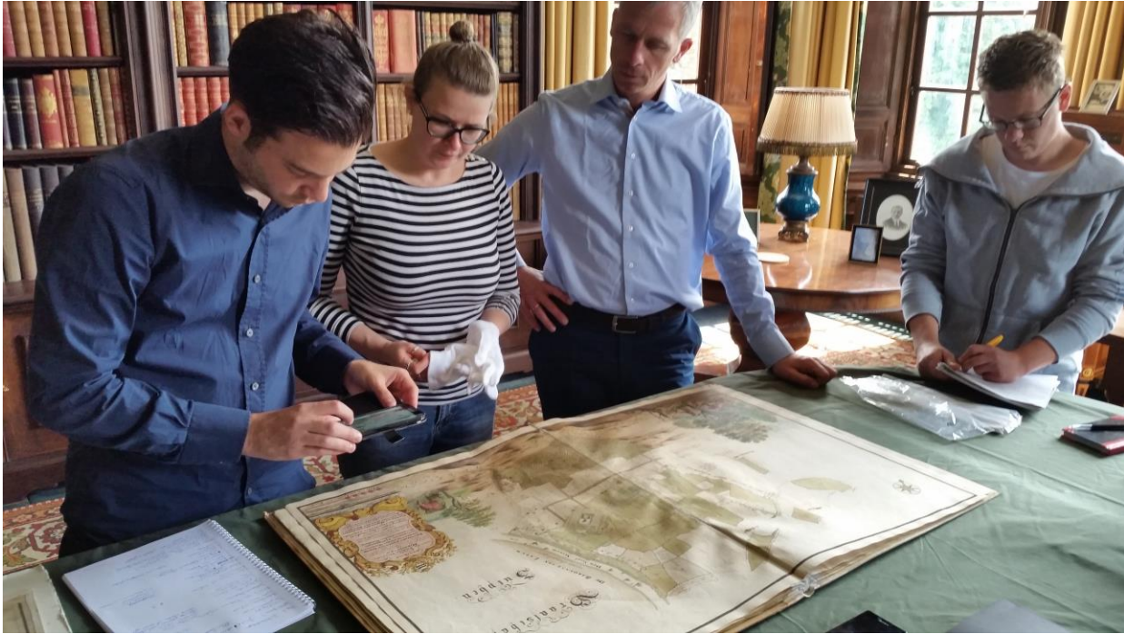
De studie van historische kaarten vormt een belangrijk hulpmiddel bij de studie van historische landschappen.