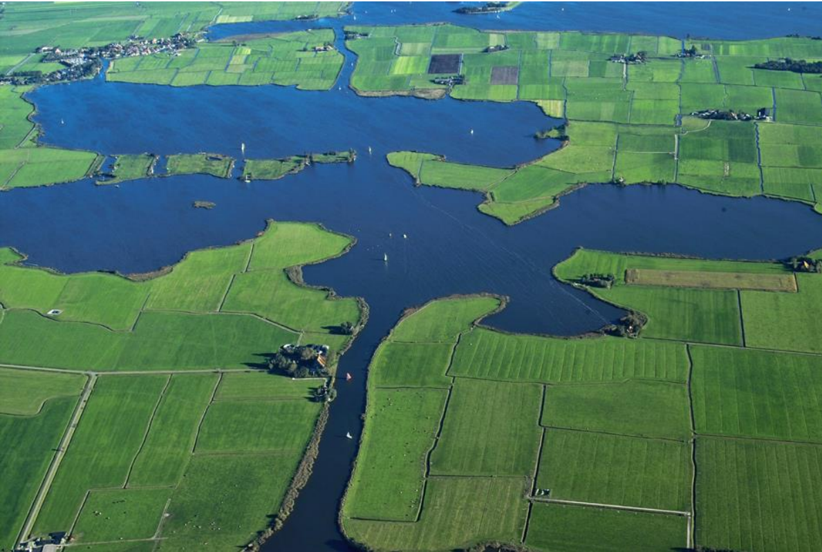
Het Gaastmeer (Zuidwest-Friesland)