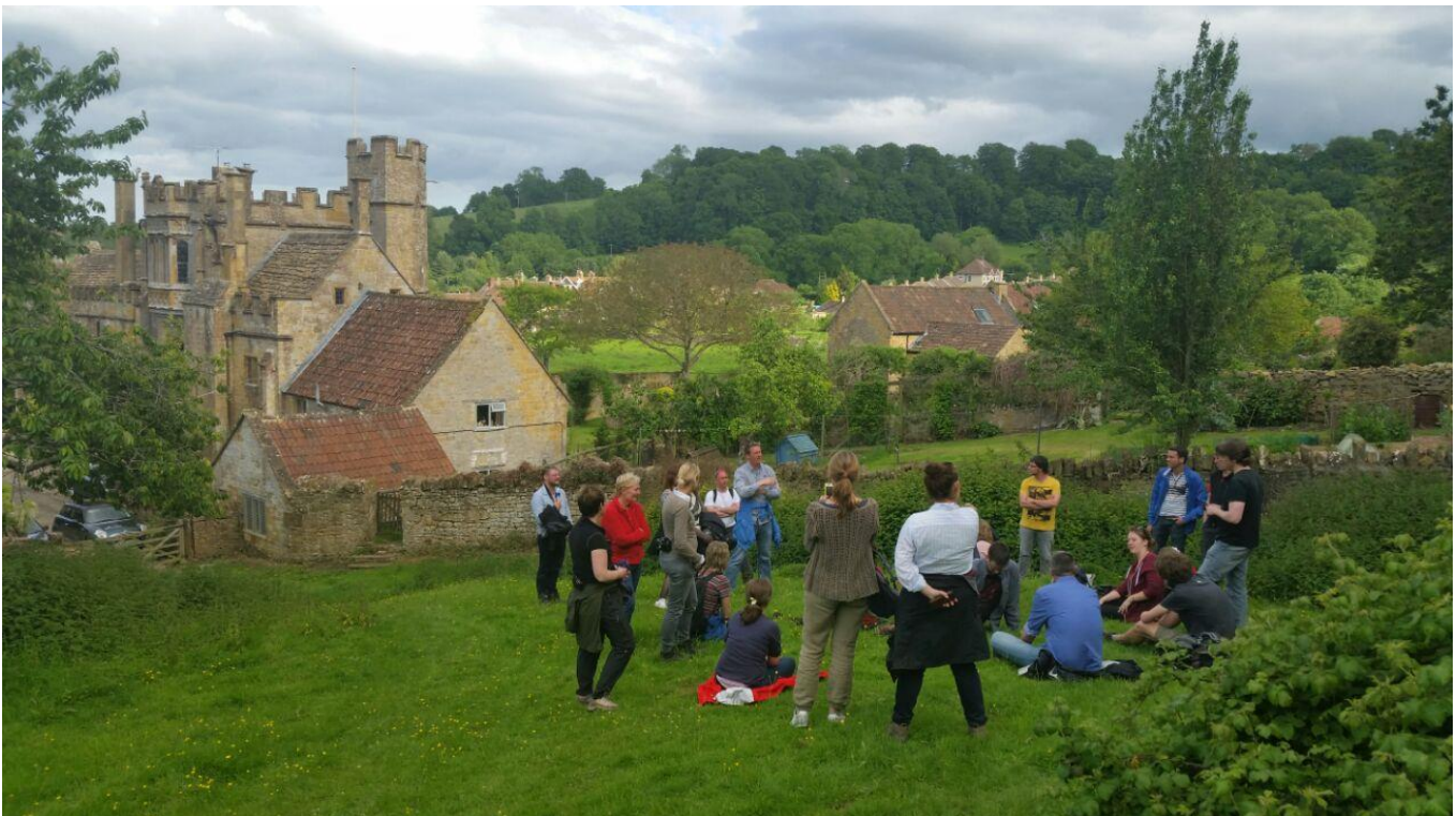
Veldbezoek Montacute (UK). Elke jaar organiseert de opleiding een landschapsexcursie van zeven dagen naar Zuid-Engeland of Noordwest-Italië.

De masteropleiding Landschapsgeschiedenis biedt een goede afwisseling van individuele activiteiten en samenwerking met andere studenten. De opleiding is toegankelijk voor bachelorstudenten (zowel HBO als universitair) met een gevarieerde vooropleiding, zoals onder meer kunst- en architectuurgeschiedenis, sociale geografie, fysische geografie of aardwetenschappen, planologie, geschiedenis, archeologie, landschapsarchitectuur, land- en watermanagement, biologie, bos- en natuurbeheer. Hierdoor kom je als student in aanraking met verschillende perspectieven op het landschap en leer je dwarsverbanden te leggen tussen verschillende vakgebieden. Jaarlijks melden zich 25-35 studenten voor deze masteropleiding aan, een aantal dat heel geschikt is om je collega-studenten tijdens colleges, studieopdrachten, werkbezoeken, veldpractica en excursies goed te leren kennen en ook een goed persoonlijk contact met je docenten op te bouwen. Naast het reguliere studieprogramma worden jaarlijks dagexcursies of veldstudiedagen georganiseerd naar diverse landschappen van Nederland. Ook is er ieder jaar een zevendaagse excursie naar Italië of Engeland.