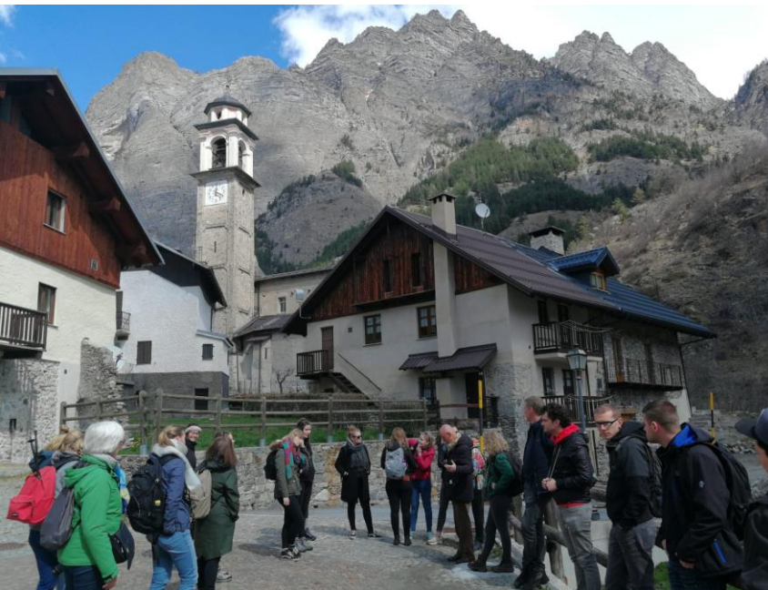
Bezoek aan de Valle Stura (Italiaanse Alpen) tijdens de buitenlandexcursie naar Noordwest-Italië (april 2019)

Een aantal studenten heeft afgelopen jaar gekozen voor het combineren van de master Landschapsgeschiedenis met een andere masteropleiding bij de RUG of op een andere universiteit. Door twee opleidingen parallel te volgen in plaats van na elkaar, vermijden zo het hoge collegegeld voor een tweede master. Omdat er sinds september 2012 geen langstudeerdersboete meer bestaat, is er in principe ruim voldoende tijd om beide opleidingen af te kunnen ronden. Wel blijkt het combineren van twee masteropleidingen in de praktijk veel planningsproblemen op te leveren, waardoor studievertragingen van 1-2 jaar geen uitzondering zijn. Reken dan dus op een totale masterperiode van 3-4 jaar. Om dit soort grote vertragingen te voorkomen, wordt zeer sterk aangeraden om beide masters niet tegelijkertijd (gemengd rooster), maar na elkaar te volgen (dat wil zeggen eerst heel master 1 inclusief masterscriptie, daarna pas master 2).