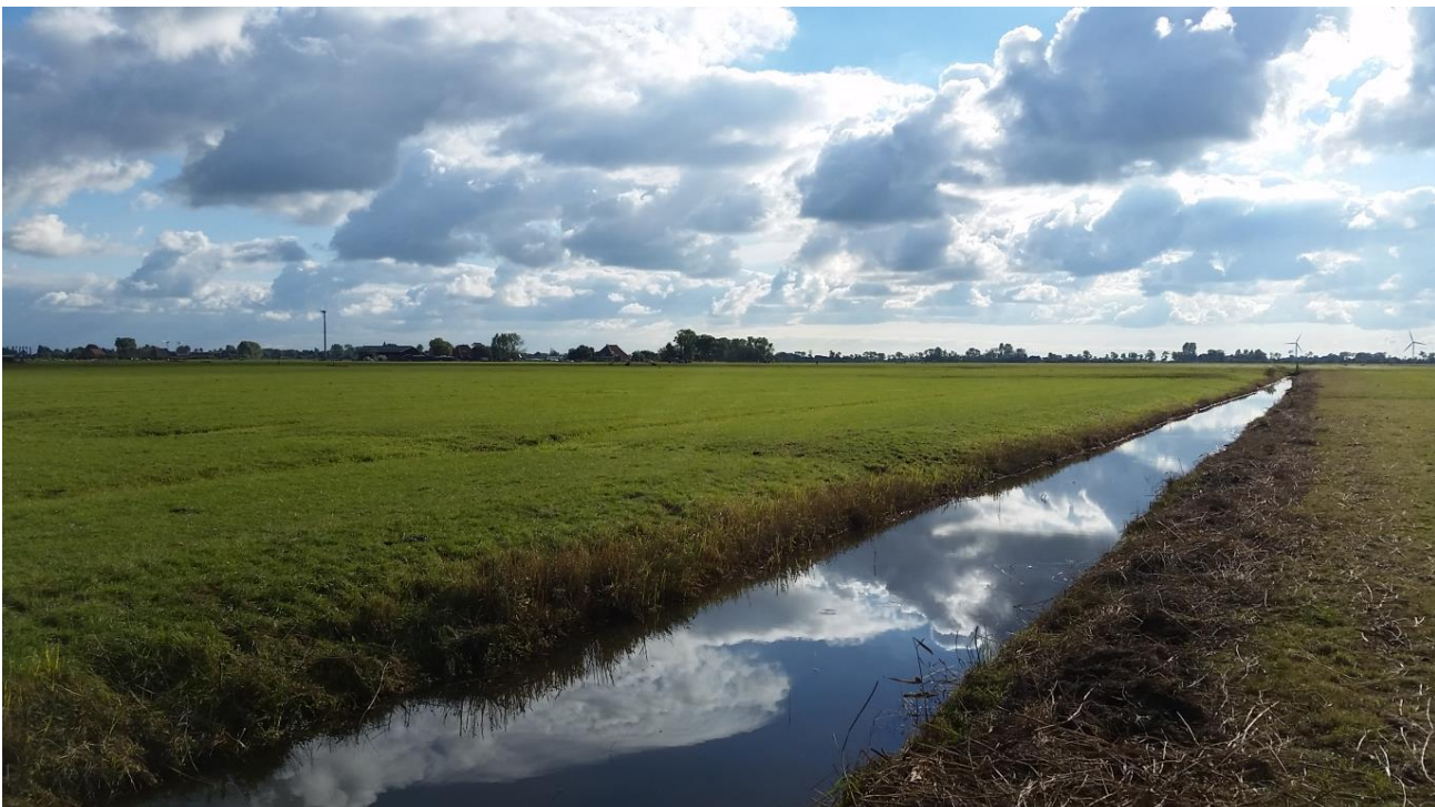
Kleiweidelandschap bij Skrok in de Greidhoeke (Friesland)

www.rug.nl/research/kenniscentrumlandschap .