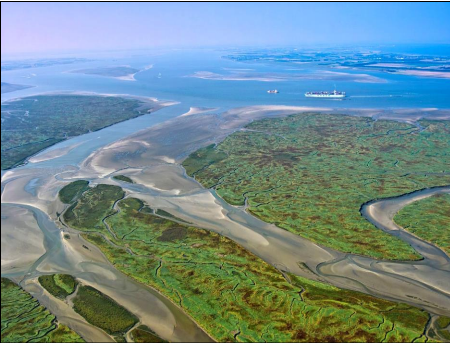
Het Verdronken Land van Saaftinge met op de achtergrond de Westerschelde (Zeeland)