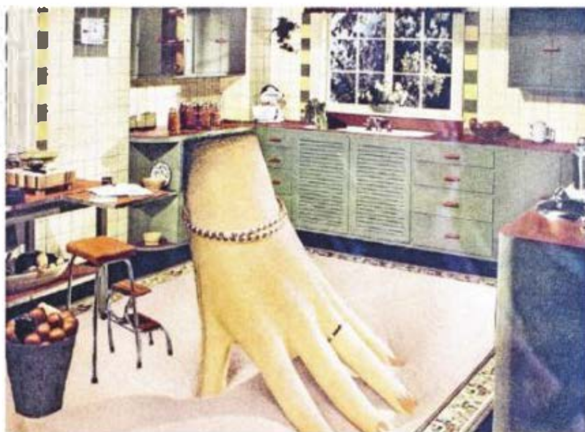
Dagelijks leven in Amerika I, technicolormontage van Hermans' hand (ca. 1952).

Schreuders: "Het merkwaardige van dit archief is, dat het nooit is uitgeweid voor het naar het Literatuurmuseum is gebracht. Weaken privé zinnen door elkaar. En wat privé is, dat wilken