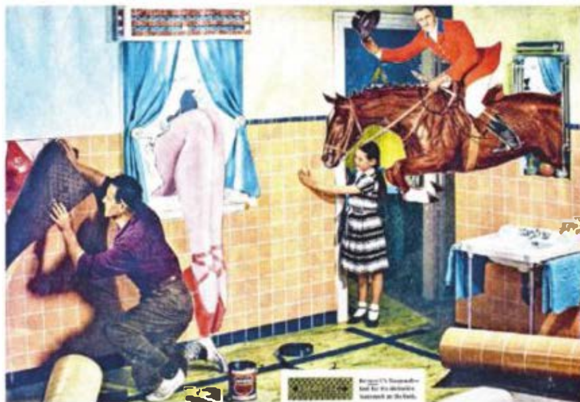
Dagelijks leven in Amerika II, technicolormontage (ca. 1952).

de er van eigenlijk niet in het boek. Hermans maakte gebruik van de lijsten van zijn foto's en dia's. Samen zijn dat er wel vijftien duizend. Bij sommige staat een 'F' in de kladlijn. Dat betekent 'familie'. Als we daar uit iets wilden kiezen, kon het wel eens moeilijk worden."