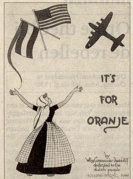
Omslag 'It's for Oranje' (1944) Illustraties uit besproken boek