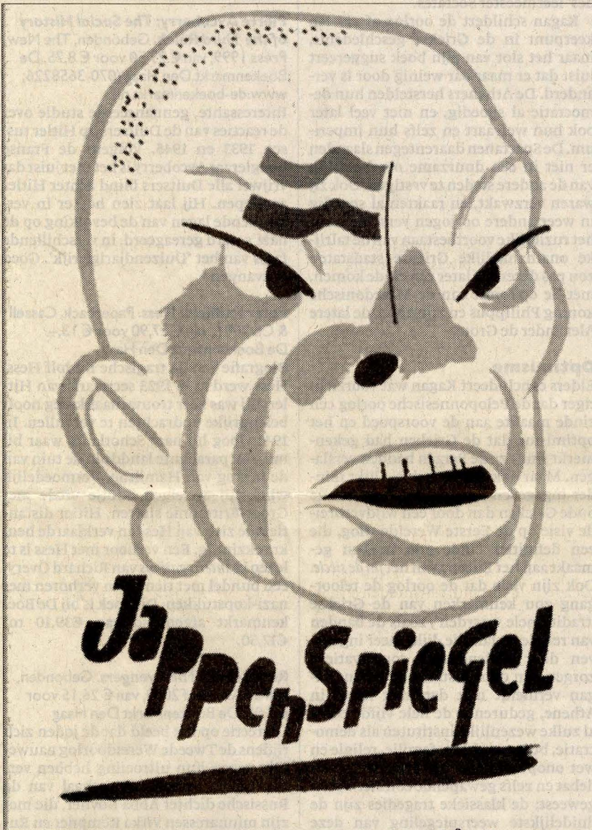
Voorpagina 'Jappenspiegel' (1945)

Hans Renders: Gevaarlijk drukwerk. Een vrije uitgeverij in oorlogstijd. De Bezige Bij, 256 blz. € 34,90